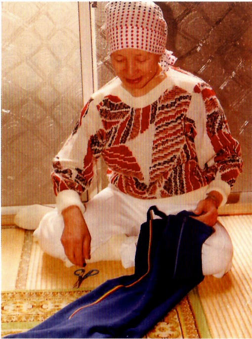
赤・青・黄色のズボン

人の思いは深い意識の次元でひびきあっている。共振・共鳴・共時性現象は、現実生活意識の中ではなかなか気づきにくくなっているが、縁結びとなる出会いには、注意深くしていると、文字的・数的・色彩的ひびきの実態がわかってくる。 心に描くこと、それも強く思うこと、一瞬でも思い描くことなど、これらの思いの形は異なっていて