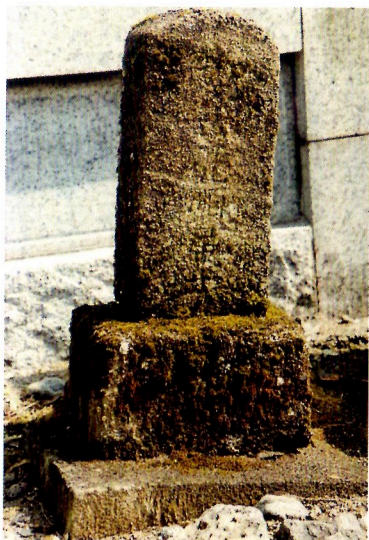
発見された祖父の墓石（孝岳亮順居士）

仏となつている先祖の墓を捜し出し、守り継ぐことがせめてもの孝行だと若者は思い立ちました。