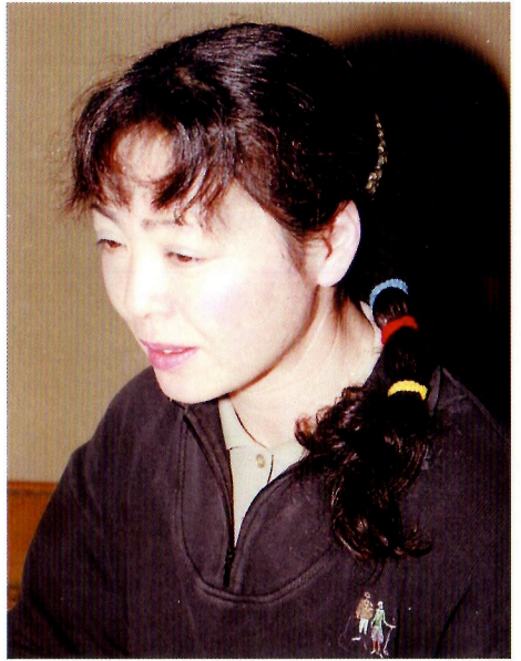
赤・青・黄色のヘアバンド

以上の話は実話をモデルにしたものである。息子役の男性は、隣国のソウル市に一四年の駐在を終えて帰国した。娘役の女性は酒田市内のT子の話である。さらに、カササギの飛来は、平成二〇年六月一二日午後一〇時半頃、日枝神社境内で実際にあったものである。