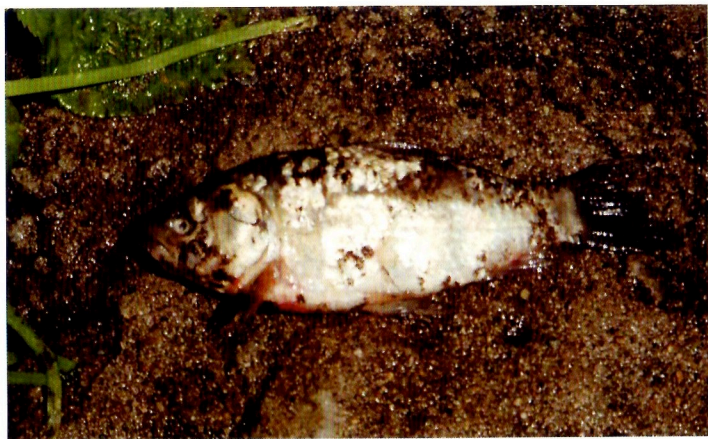
天から降ってきた鯉