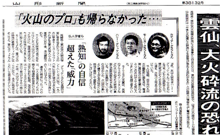
平成3年6月7日付、山形新聞朝刊を転載

く生まれ変わるための元の姿、すなわち生命元素に戻ることが、死という扉開きといえる。