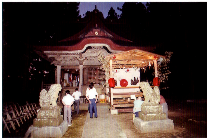
比山芸能（重要文化財）の舞台（熊野神社）

夢はいのちの子 現実もいのちの子 一卵性の双子です 夢と現実が双子です 一卵性の双子です 心も体もいのちの双子 夢は心性（心）で 現実が物性（肉体）で 一卵性の双子です 分離できない双子です あるときは夢で あるときは現実で 表裏一体の双子です いのちが生んだ双子です